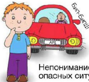
Непонимание опасных ситуаций

Registered Charity No: 1148010 Support when you need it the most. www.autimpuzzles.co.uk Tel: 07071 045128