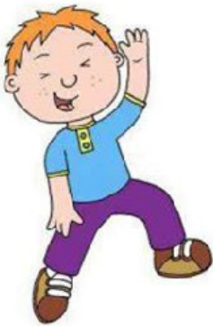
Гиперактивность или пассивность