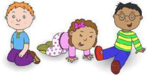
Неумение находить общий язык с другими людьми