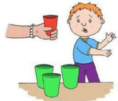
Неумение или нежелание приспосабливаться к изменениям