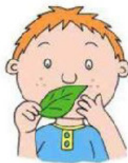
Странное отношение к предметам