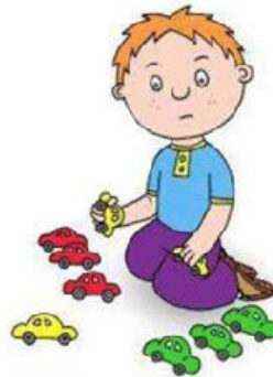
Использование игрушек не по назначению