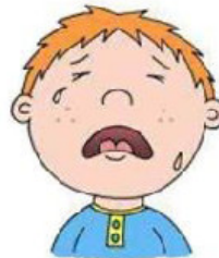
Смех или плач без причины