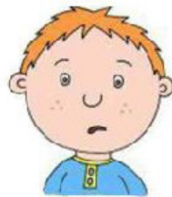
Отсутствие речи или её слабое развитие