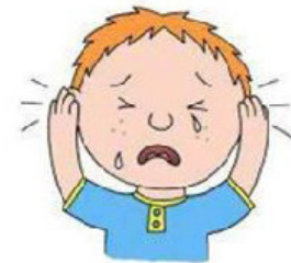
Гиперчувствительность или слабая чувствительность к посторонним звукам